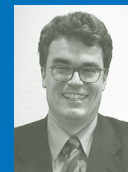
Martin G. Bernhard ECG Management Consulting GmbH